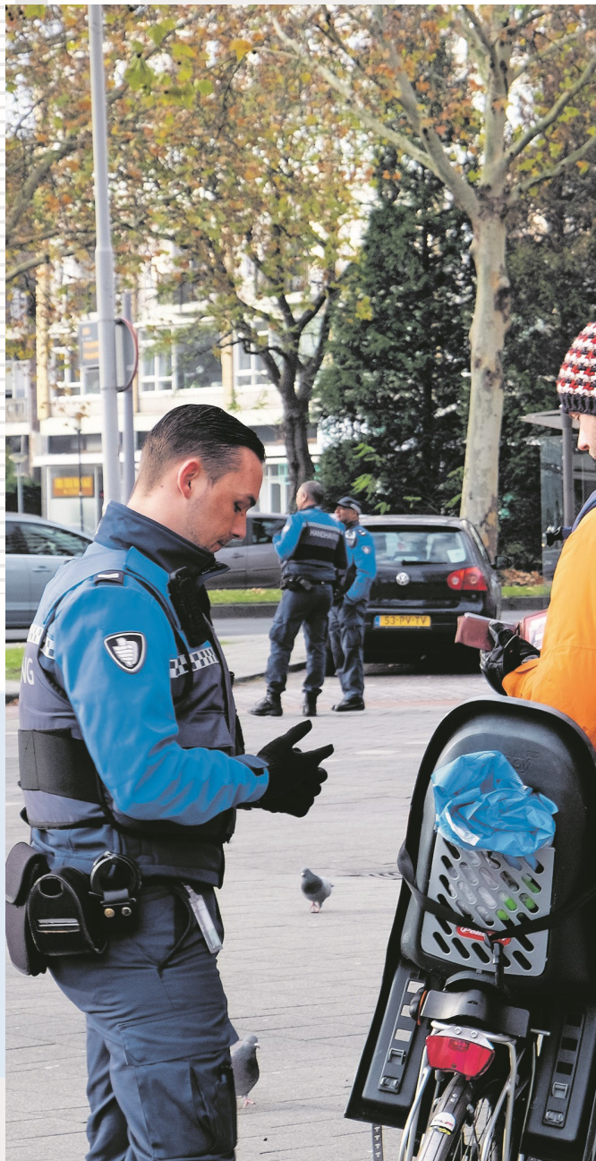
Een bijzondere opsporingsambtenaar heeft een fietser tot stilstand gebracht.

Maar dat het op straat niet altijd even prettig toegaat in de bejegening van boa's ervaren die juist heel vaak in – wat Gerrits plechtig noemt – 'het verkeersdomein'. Wat een boa niet allemaal te verstouwen krijgt van een automobilist! Hoe horkerig de scooterjochies kunnen zijn! Om nog maar te zwijgen over die zo